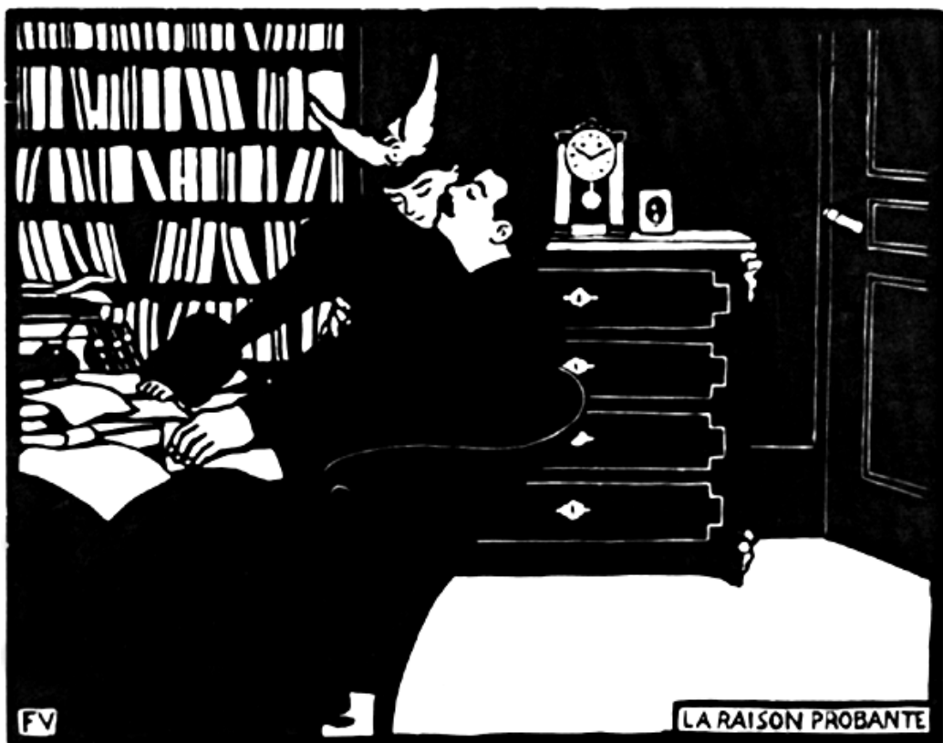
Félix Vallotton, La raison probante (gravure sur bois, 1898)

Vallotton (né à Lausanne, 28/12/1865 ; mort à Paris, 29/12/1925) est un peintre et graveur sur bois. La gravure sur bois est une technique qui va amener Vallotton à une simplification des motifs, concentrés en surfaces noires et blanches.