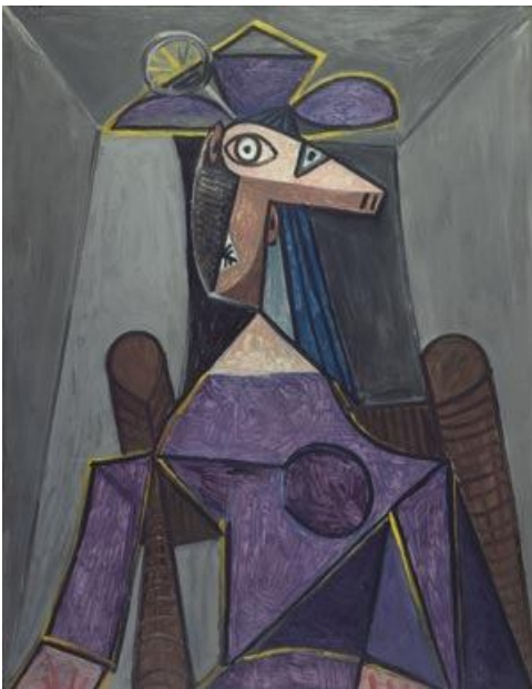
Portrait de femme, 1942

Pablo Ruiz Picasso , (né à Málaga, Espagne, le 25 octobre 1881 et mort le 8 avril 1973 à Mougins, France), était un artiste espagnol. Il est principalement connu pour ses peintures, mais fut aussi sculpteur, et est l'un des artistes majeurs du XX ème siècle. Il est, avec Georges Braque, le fondateur du mouvement cubiste. (L'objet est déconstruit, et toutes ses facettes sont représentées en fragments). Source : d'après Wikipédia.