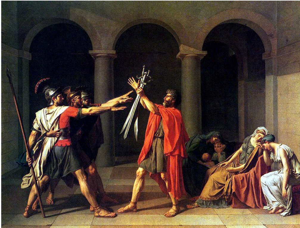
Le serment des Horaces, David, 1784