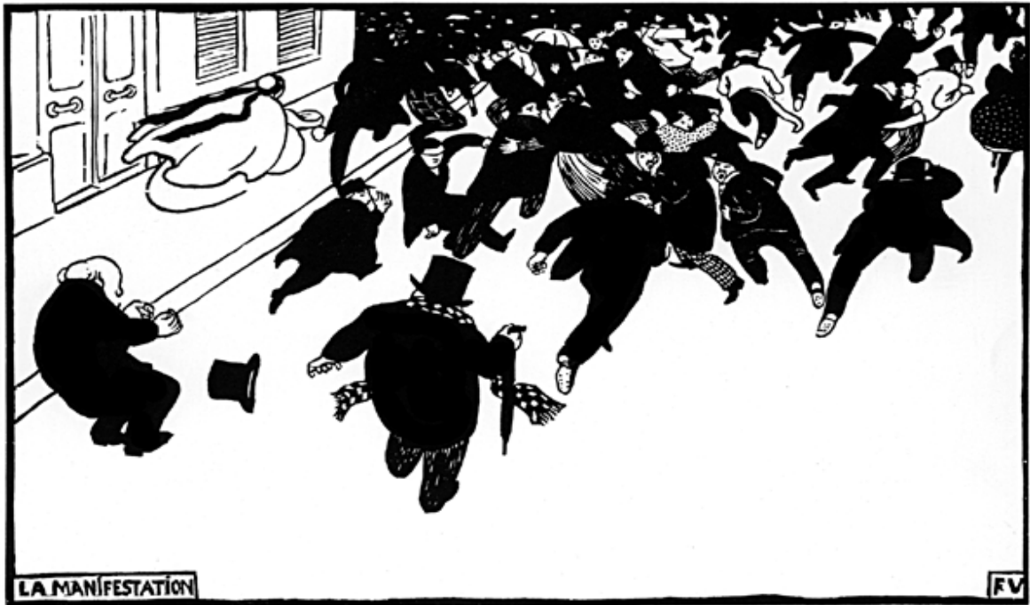
Félix Vallotton, La Manifestation (1893, gravure sur bois)