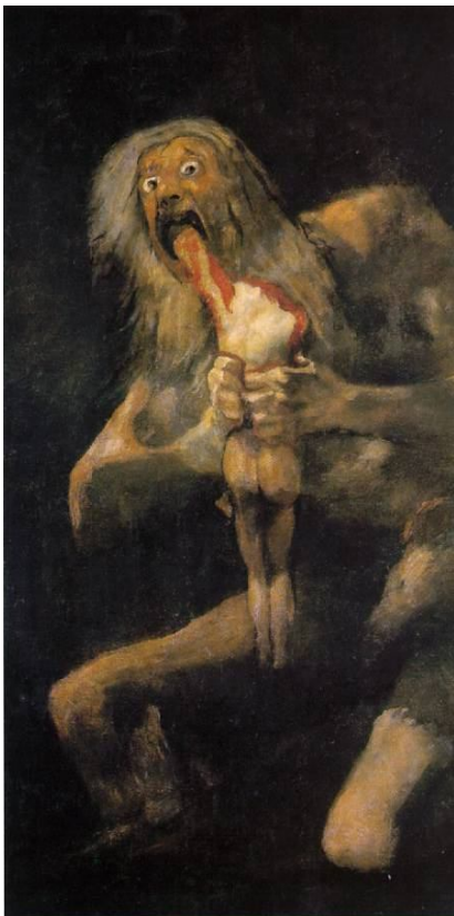
Saturne dévorant ses enfants, Goya 1815