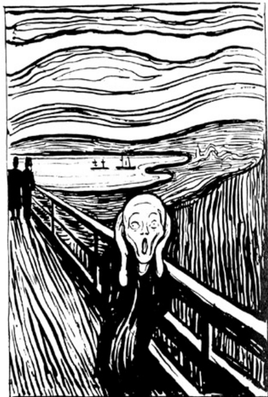
Le cri, Edvard Munch 1893