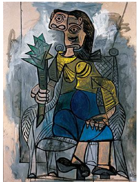
Femme à l'artichaut, 1940